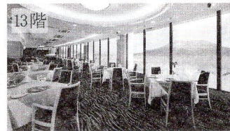
スカイラウンジ フェニックス