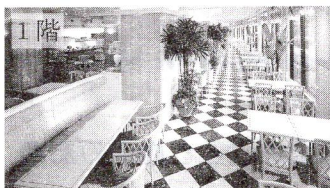
カフェレストラン トリアン