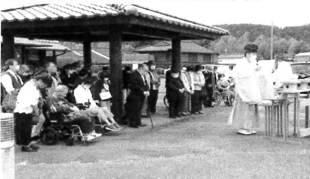
◎身体障害者一日レクリエーション(R2.11.1, 4, 8)