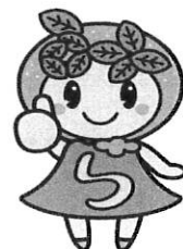
イメージキャラクター 「みいちゃん」