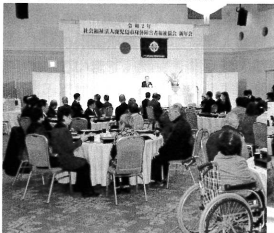
◎新年会(R2.1.19:サンロイヤルホテル)