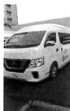
◎当協会継続支援B型事業所ゆうあいの郷に送迎車デビュー(R2.10.23)