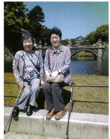
皇居二重橋にて H24年 全国大会