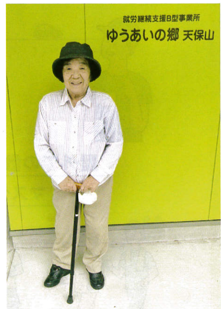
ゆうあいの郷 天保山作業所前