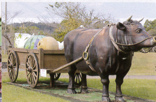
お土産を買いすぎて荷馬車で運びました（笑）

お疲れ様でした。さわやかな秋空の下、久しぶりの修学旅行気分ですっかり若返りました。志布志湾のきらめく海を眺めながらいただくお食事もお買い物もメッチャ楽しめました。ご協力ご支援いただきました皆様に心から感謝申し上げます。本当にありがとうございました。次回もよろしくお願い致します。次は何処に行こうかな？。