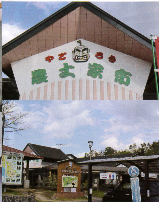
おすみ弥五郎伝説の里でトイレ休憩