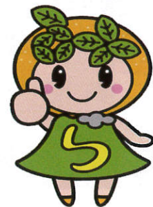
イメージキャラクター 「みいちゃん」

鹿児島みらい農業協同組合 本店 〒892-0824 鹿児島市堀江町19番1号 TEL : 099-224-1231 FAX : 099-223-6249 URL https://ja-kagosimamirai.or.jp/