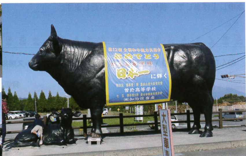
和牛日本一 今回はお肉はお預けでした 次回は是非日本一のお肉を食べたいな～