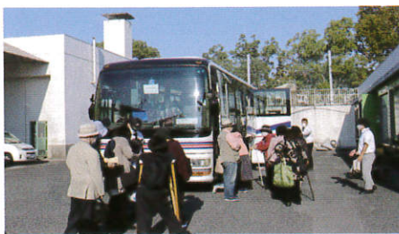
バスに乗り込み志布志へ出発