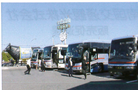
和牛に見守れながらトイレ休憩