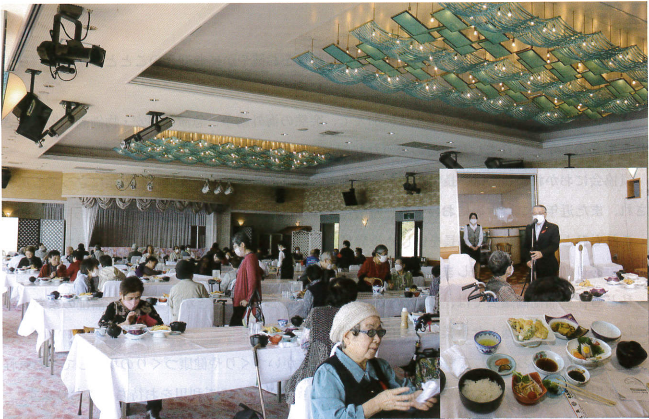
長旅でお腹も空きました 料理も美味しくて完食しました

昨年は和牛日本一の郷～弥五郎伝説の里 そして 食事・景色は志布志大黒の旅でした 写真を見ながらもう一度旅しましょう