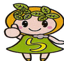
イメージキャラクター