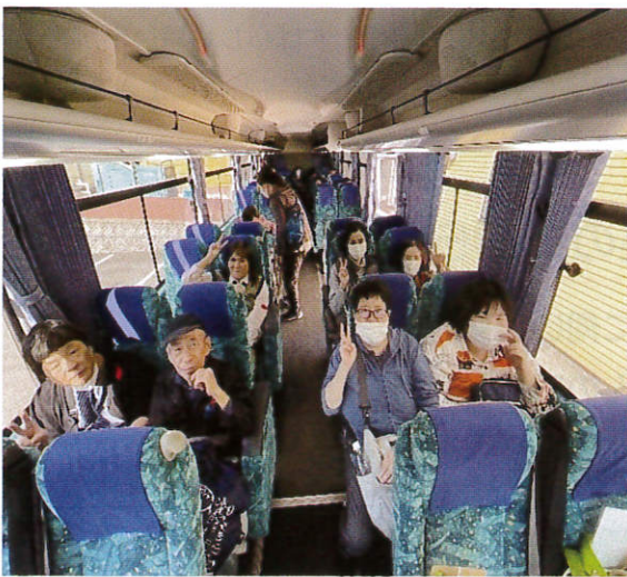
バスに乗り込みいざ出発

3号線沿い西方海岸の絶景を車窓より眺め、おいしい食事の後は 活魚・新鮮な野菜のお買い物！