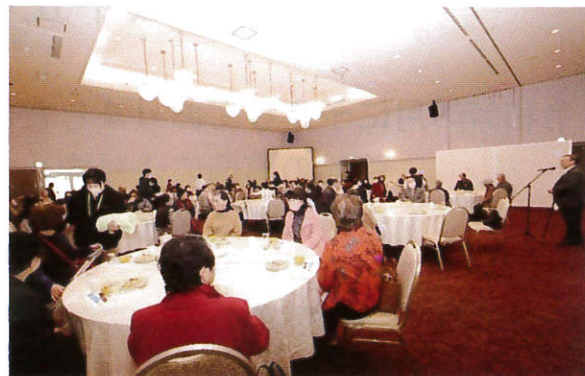
理事長挨拶。早く食べたいよ～