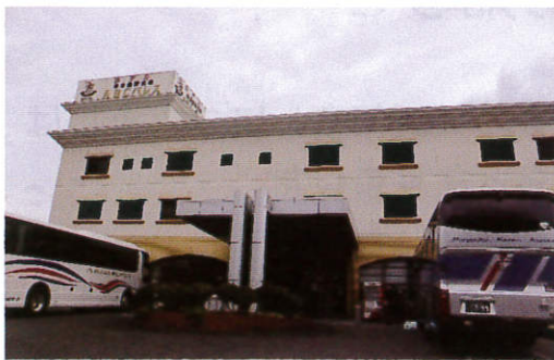
楽しい食事会場ABCパレス、到着！