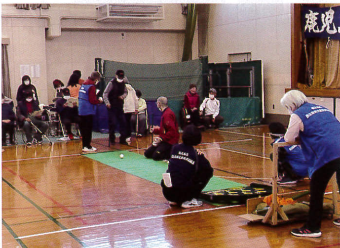
身体 スカットボールの競技風景