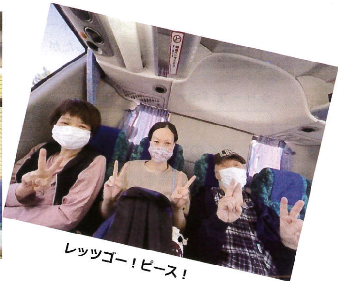
レッツゴー！ピース！