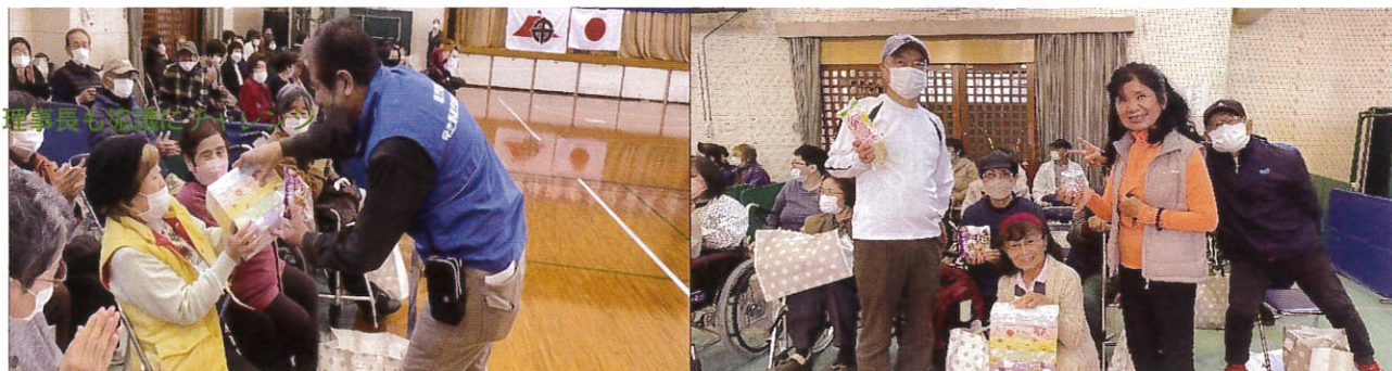
賞品をいっぱい頂きました