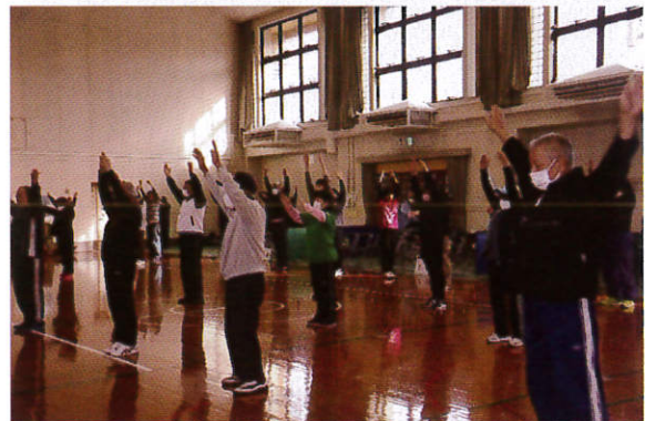
体をほぐしガンバルぞ~!!