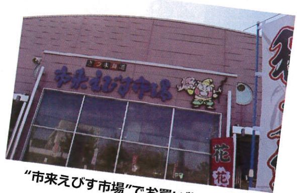
“市来えびす市場”でお買い物