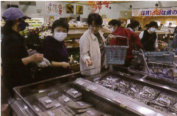
美味しそうな乾物見つけた！