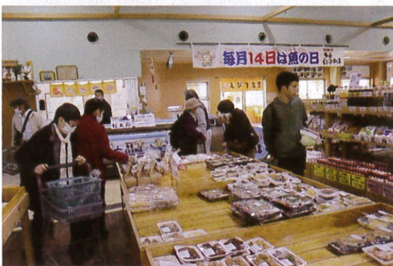
今晚のご飯にしようかな、...