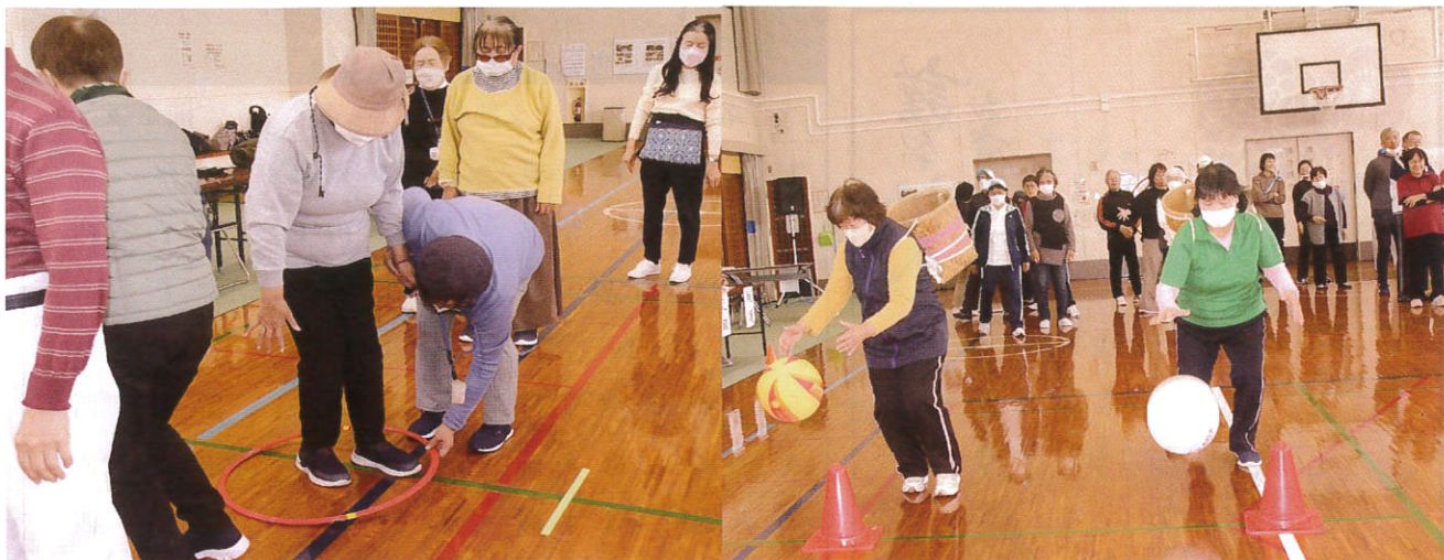
視覚 スマートに行こうの競技風景