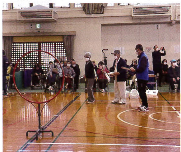
身体 フライングディスクの競技風景