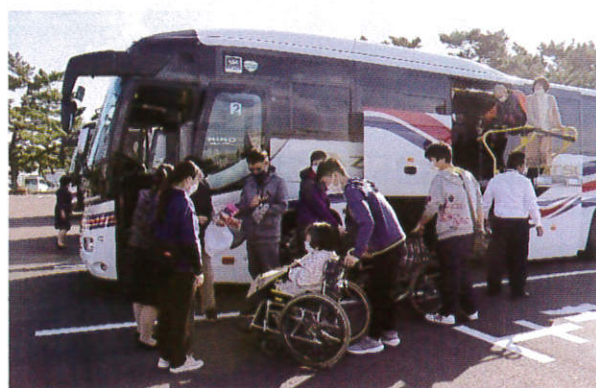
お買い物もたくさんできたので帰路につきます えびす市場さん、ありがとうございました！

お疲れさまでした！絶景な海岸沿いのドライブ・美味しいお食事・お買い物、満足して 帰路につきました。来年はどこがいいかな～！ ご協力ご支援いただきました皆様に心から感謝いたします。ありがとうございました。