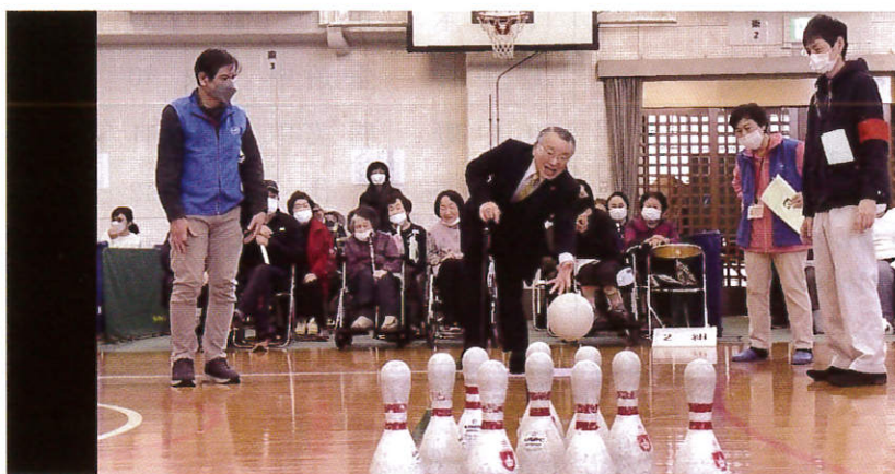
理事長も競技にチャレンジ